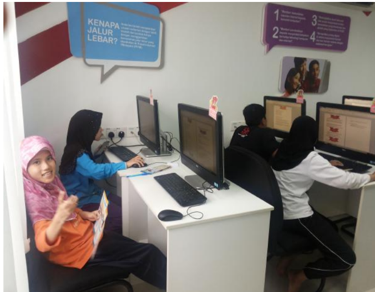
Pelajar OKU (belakang) – lambat pembelajaran turut mengikuti kelas yang dianjurkan oleh PI1M