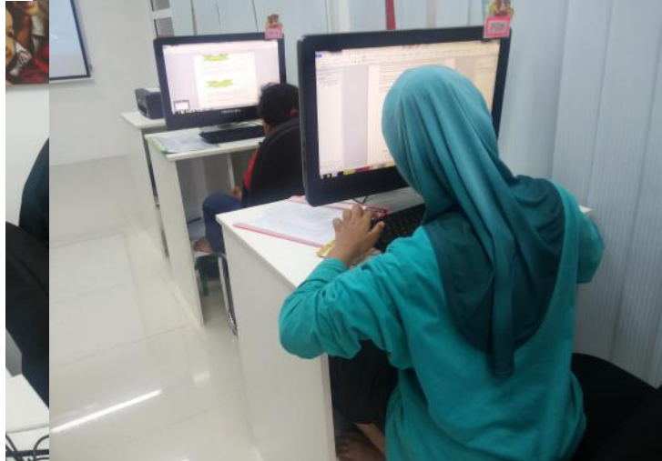
Para pelajar menggunakan aplikasi di MS Word iaitu SmartArt